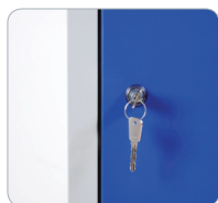
Serrure à Clefs VE-SC-001