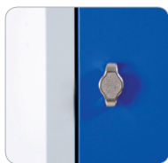
Serrure Loqueteau Morillon VE-LO-002