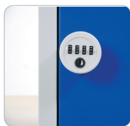
Serrure à Code VE-SAC-001