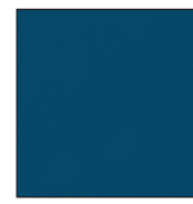
Bleu RAL 5010

Contactez nous pour d'autres coloris non standards