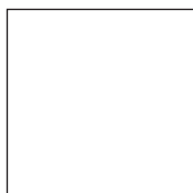
Blanc RAL 9003