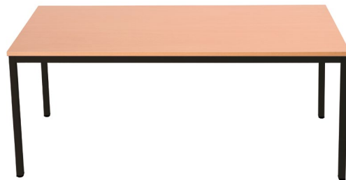
TABLE PLATEAU HETRE PIETEMENT GRIS :