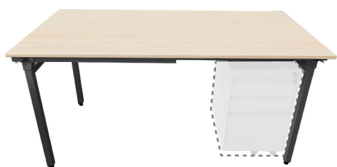
Usage possible avec caisson mobile