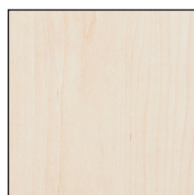
Décor bois Hêtre clair