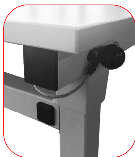
Position pied bloqué