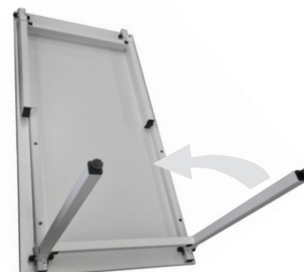
4 butées de protection pour empiler les plateaux