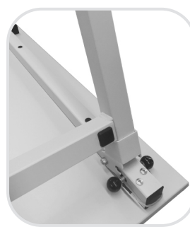
Position pied débloqué*